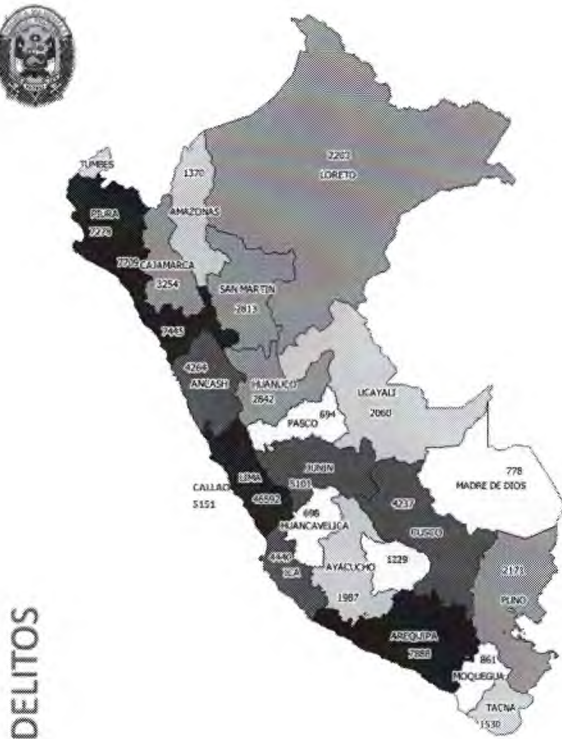
MAPA DENUNCIAS POR DELITOS SEGÚN DEPARTAMENTO (I TRIMESTRE - 2022)

En el I trimestre del año 2022, se puede observar que las denuncias por delitos se han concentrado en los departamentos de Lima (46,592), Arequipa (7,888), Lambayeque (7,709), La Libertad (7,445) y Piura (7,278).