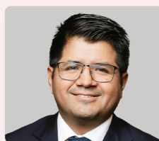
Fort Ninamancco Córdova