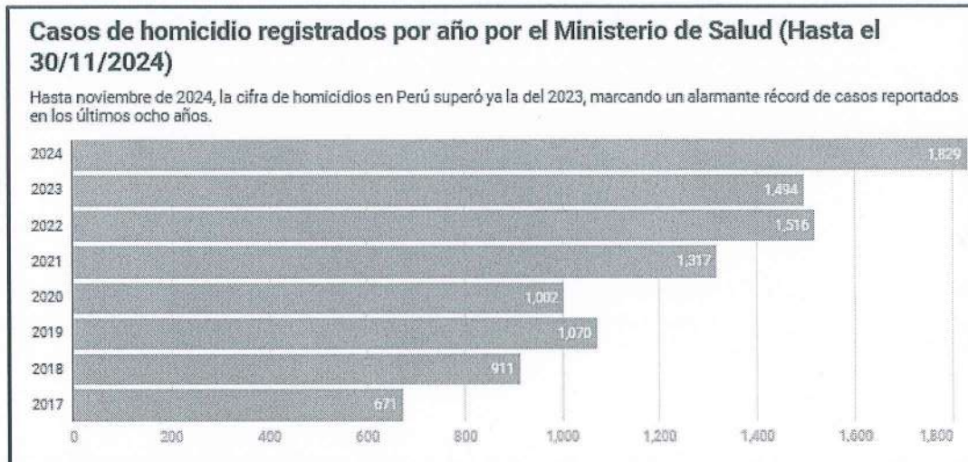
Cuadro N°2: Homicidios Perú 2017 – 2024

de homicidios se suscitaron en el mes de noviembre de 2024, en particular en la ciudad de Lima, pese a la declaratoria de emergencia dispuesta.