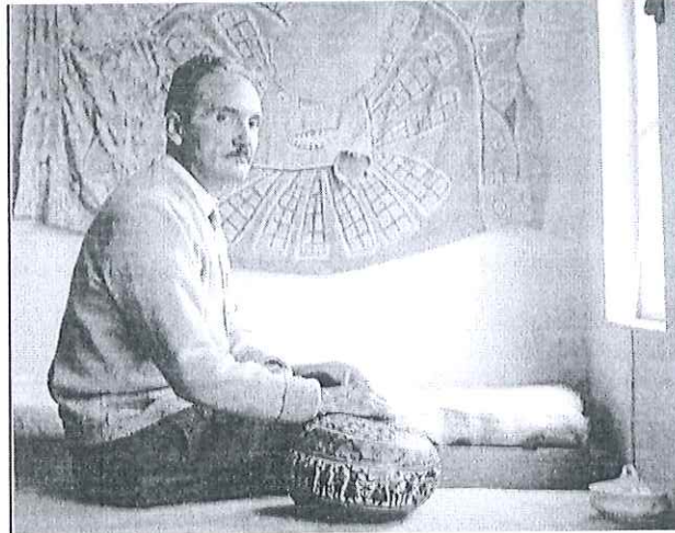
Imagen 1 6

De la revisión de la fotografía objeto de denuncia, esta Comisión observa elementos que confieren originalidad. Así se aprecia la deliberada elección por parte del autor en cuanto a la disposición de los objetos, la ubicación estratégica del personaje central, quien se sitúa frente a la ventana, permitiendo así que la luz natural incida sobre su cuerpo y rostro, generando sombras que contribuyen a la composición visual. Asimismo, si bien el autor José María Arguedas cuenta con diversas fotografías en las que se le observa de perfil, cada una de las instantáneas muestra una representación distinta de dicha posición, esto se puede advertir de las fotografías aportadas por la denunciada (ver imagen 2), a pesar de las múltiples imágenes en las que el reconocido literato adopta una perspectiva de perfil, cada una de ellas ofrece una visión única de su figura, lo que refuerza la noción de que existe cierta arbitrariedad por parte del fotógrafo para definir su posición en la obra fotográfica objeto de denuncia. Además, se constata que el autor ha procurado plasmar en el encuadre al reconocido autor rodeado de objetos que transmiten su identidad artística y su conexión con el tema del indigenismo.