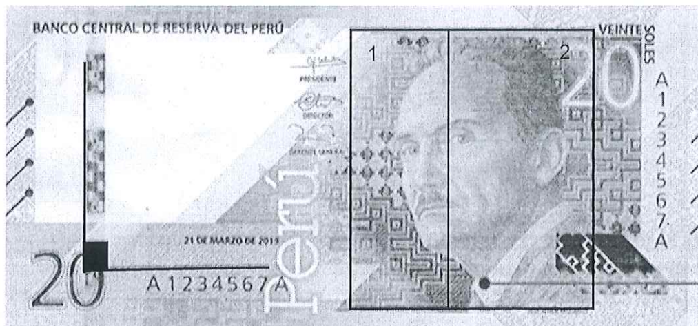
Imagen 4 9