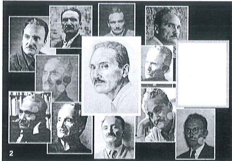
Imagen 2 7