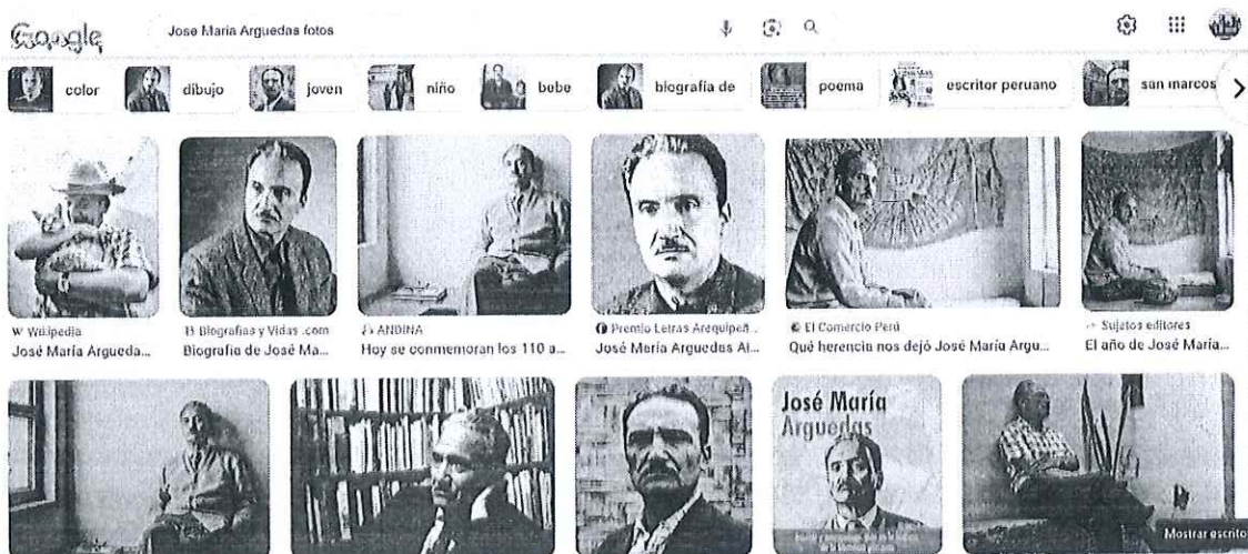
Imagen 6 11

Al respecto, tal y como se indicó previamente, a pesar de la presencia de diversas fotografías del autor José María Arguedas en posición de perfil, cada una de ellas muestran una representación única de dicha posición. Además, en cada una de estas fotografías, la mirada del autor está dirigida hacia distintos ángulos. Lo antes indicado se advierte en la imagen 2 y en la búsqueda simple de imágenes realizada en Google (Imagen 6). Cabe destacar que, aunque cada fotografía es distinta, estas logran capturar la personalidad del reconocido autor. En virtud de lo anterior, se deduce que pese a las múltiples imágenes en las que el reconocido literato adopta una perspectiva de perfil y fija su mirada, cada una de ellas ofrece una visión singular de su figura. En consecuencia, se observa que la denunciada ha reproducido parte de la fotografía objeto de denuncia, pues en el billete de veinte soles se presenta el rostro de José María Arguedas en la posición exacta en la que figura en la mencionada fotografía.