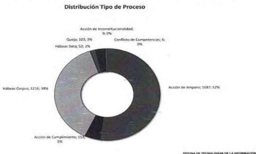
Figura 3: Ingreso de expedientes 2024, distribución por tipo de proceso

En esta dirección, la iniciativa, se justifica en que el incremento de magistrados del Tribunal Constitucional de siete a nueve permitirá reducir la carga procesal, es decir, más magistrados podrán resolver más casos en menos tiempo, ya que al haber más magistrados las ponencias se repartirán entre más magistrados, disminuyendo la carga individual, permitiendo que la productividad individual y colectiva aumente. Así también, al haber nueve magistrados se implementará tres salas de tres magistrados cada una, considerando que la carga prácticamente del 100% del Tribunal Constitucional es sobre la tutela de derechos, en tanto los procesos orgánicos no llegan al 1% de su carga total 40 . Acompaña la figura 3: