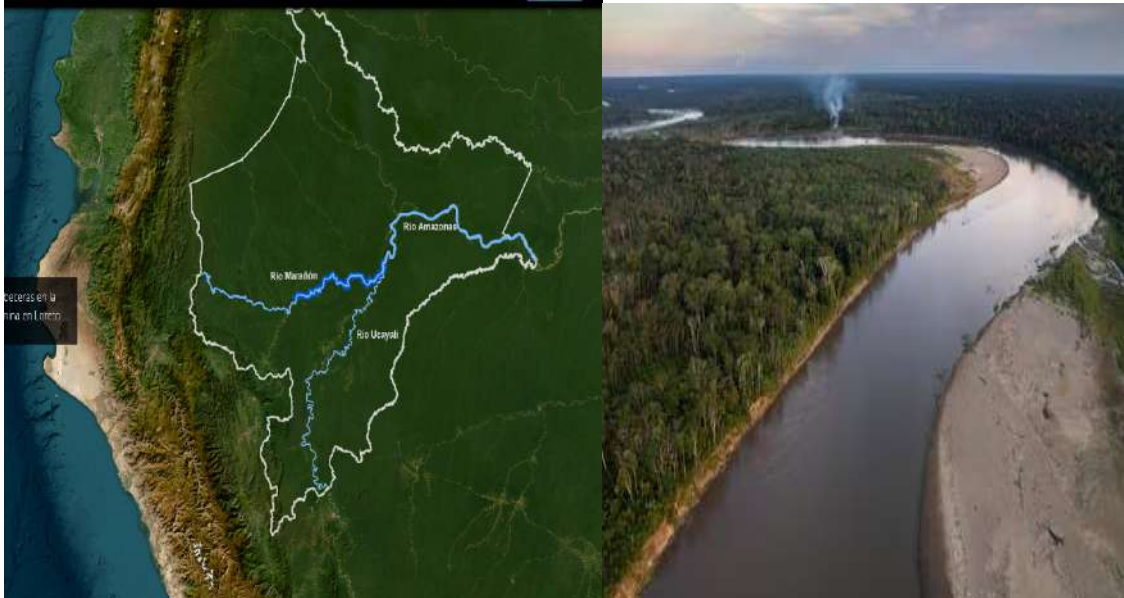
Foto Río Marañón

planicie de selva baja aluvial e inundable, con sus diversas islas, caños y cochas. Aquí se albergan más de 1.025 especies de vertebrados, como el manatí, el delfín rosado, el delfín gris y el jaguar, además de 449 especies de aves.