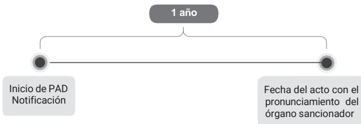
Diagrama 30 Plazo de prescripción para terminar el PAD