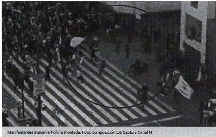
Manifestantes atacan a Policía montada.

Huacho: capturan a principal sospechoso de feminicidio de 2 hermanas en hospedaje Rutas de Lima anuncia que subirá el precio del peaje a S/7.50