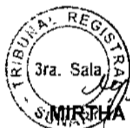
MIRTHA RIVERA BEDREGAL Presidenta de la Tercera Sala del Tribunal Registral