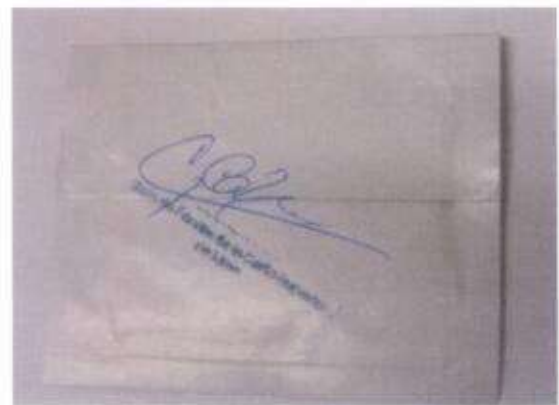
FOTO 7 SELLO Y FIRMA DE LA AUTORIDAD EN EL SOBRE