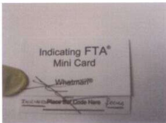
FOTO 6 FIRMA DE LA AUTORIDAD EN LA TARJETA FTA

Luego de ser realizada la toma: el Juez o fiscal firman la carilla externa de la Tarjeta FTA o soporte donde se realizó la colecta de muestras. La muestra debe ser colocada en un sobre, el cual es lacrado y el Juez o Fiscal firman encima del lacrado y colocan su sello. En el sobre se coloca el nombre de las personas a las que se colectó la muestra y el grado de parentesco, así como lugar y fecha de toma. (Fotos 6 y 7)