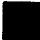
----- GLADYS MARGOT ECHAIZ RAMOS FISCAL DE LA NACIÓN