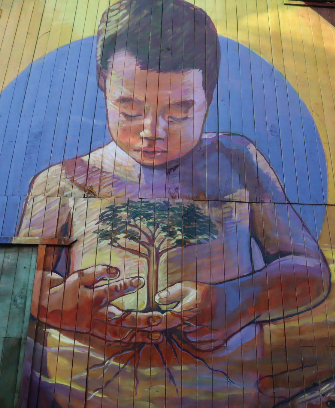
Mural del Movimiento de Artistas Shipibos Financiado por el Fondo Socioambiental del Perú.