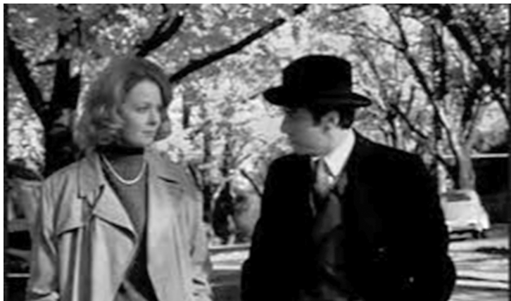
Kay Adams y Michael Corleone

Luego de asesinar a Virgil “El Turco” Sollozzo y al capitán McCluskey Michael huye a Sicilia. Se casa ahí con Apolonia y enviuda debido a la traición de Fabrizio, su guardaespaldas: el coche voló en pedazos con Apolonia adentro. El atentado salió mal. Debido a las gestiones de su padre en América, quien se reunió con los miembros de la “comisión” 39 para lograr un acuerdo de paz, consigue el “salvoconducto” para regresar a su país sin que corra riesgo su vida. Es famoso el monólogo que dio Don Vito para obtener la inmunidad de su hijo: