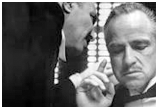
Bonasera hablándole al oído al “Padrino”