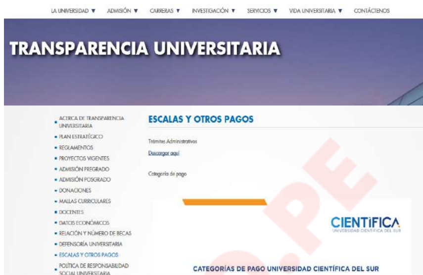
Imagen N° 2: portal de Transparencia Universitaria

94. Respecto a los trámites administrativos, se identificó que en los procedimientos que se detallan a continuación, la Universidad exige que los estudiantes se encuentren al día en los pagos de sus pensiones: