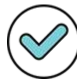
Tabla N° 03