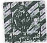
ZORAIDA AVALOS RIVERA Fiscal de la Nación