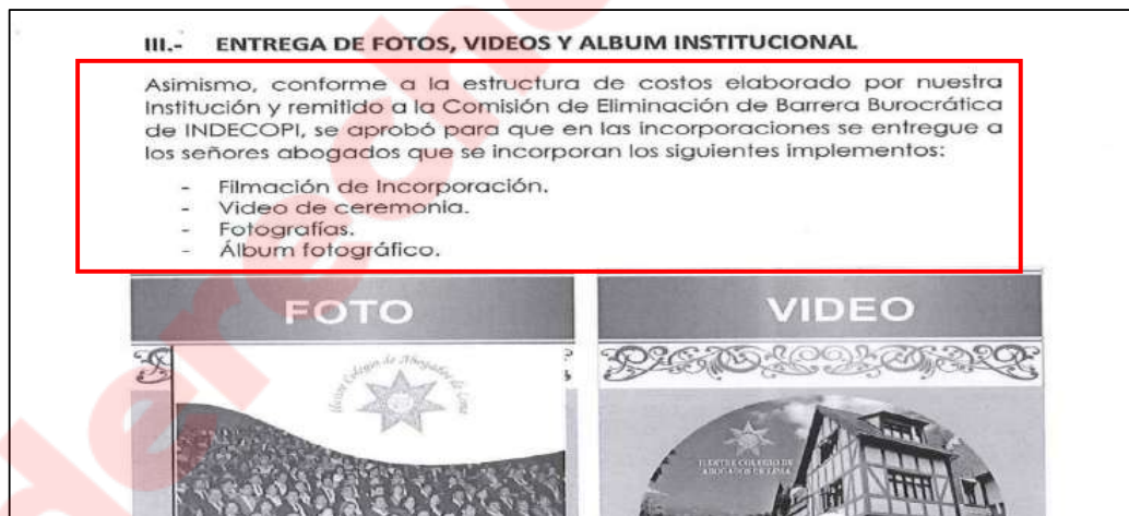
IMAGEN 6 TERCER INFORME SEMESTRAL DE ACTIVIDADES DEL VICEDECANATO