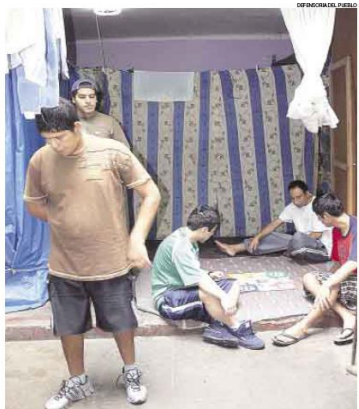
COLAPSADO. El centro transitorio Santa Bárbara no puede recibir a más procesados con arresto domiciliario.

OCMA INVESTIGARÁ Los juzgados disponen de un listado de un caso a una clínica alborde para su tratamiento médico. Trascendió que la Ombudsman Con-