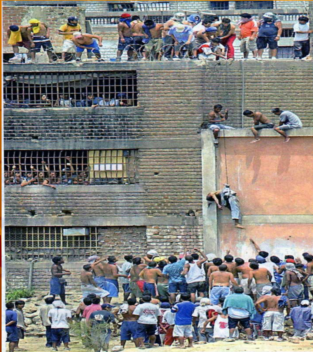
>Caos. Los violentos sucesos ocurridos en el penal Castro Castro evidencian, una vez más, que las bandas de asaltantes, secuestradores y narcotraficantes controlan los penales con la complicidad de policías y personal del INPE.